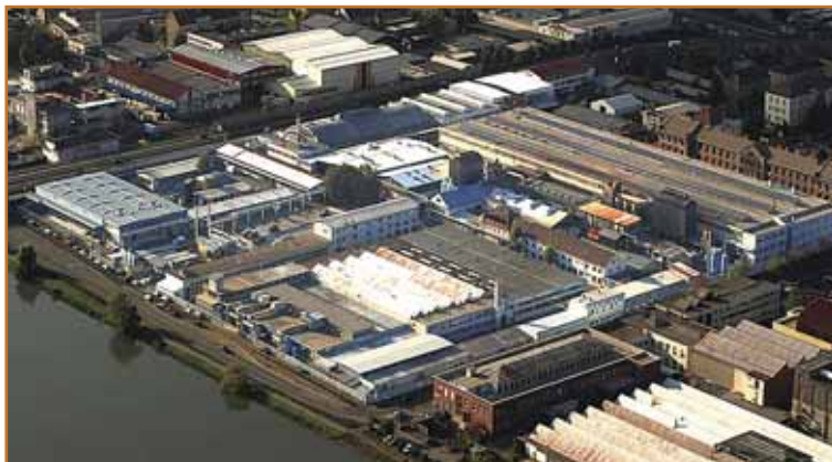
Mariborska livarna Maribor se nahaja v središču mesta

MLM je enovito podjetje s tremi, dokaj različnimi proizvodnimi programi: Alutec, Baker in Armal.