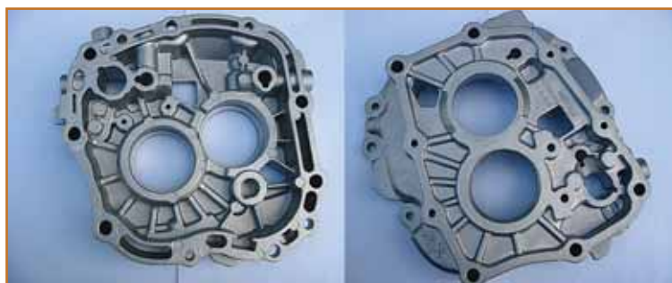
Al tlačni ulitek – ohišje menjalnika