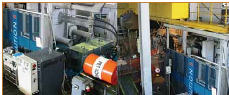
Sklop nove livne celice

Učiti se skozi napake je sicer zanesljiva, vendar bistveno predraga metoda učenja, pa tudi okoljsko izredno sporna. Zato smo investirali v program za simulacijo litja MAGMASOFT, s katerim simuliramo litje, izdelamo več variant, poiščemo najboljšo rešitev in šele nato izdelamo drago livno orodje. Simulacijo litja zahtevajo tudi naši kupci, ki danes ne preverjajo več naročenih izdelkov, ampak naš koncept proizvodnje, ki mora biti zanesljiv, stabilen in seveda 100 % sledljiv.