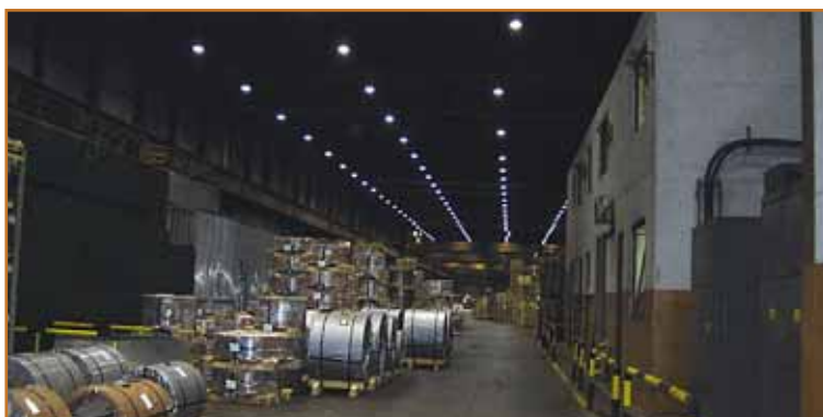
Stanje po rekonstrukciji

Za zadnji projekt je bila pogodba med naročnikom in izvajalcem sklenjena v mesecu maju 2006.