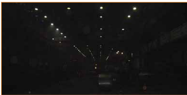
Stanje pred rekonstrukcijo

Prenova razsvetljave v Acroniju poteka po etapah (halah profitnih centrov). Pričelo se je maja 2004 v hali PC PDP (profitni center Predelave debele pločevine) in spremljajočih objektih (strojnicah, skladiščih in pisarnah), nadaljevalo s halo skladišča jeklenega vložka v PC VP (profitni center Vročne predelave) ter v hali in spremljajočih objektih PC HP (profitni center Hladne predelave). Trenutno se izvajajo dela v profitnem centru Vročne predelave, in sicer v hali Vročne valjarne.